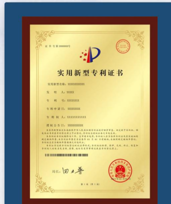
实用新型专利（附加）