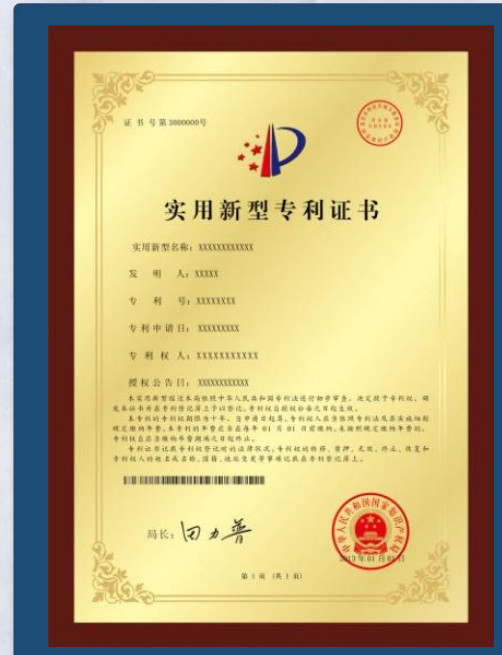
实用新型专利 (附加)