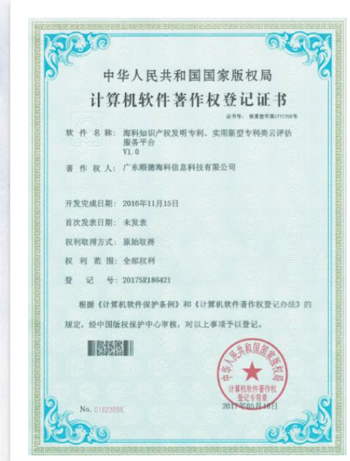
软件著作权 (登记手续复杂, 不建议)